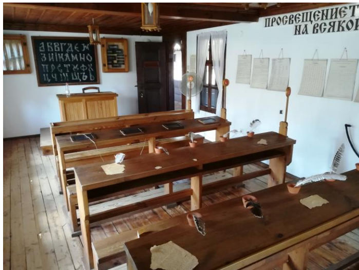
В центъра е и Старото школо – днес музей с автентична класна стая от преди 150 години, картини от Иван Попдимитров (вляво), колекция от картини на Димитър Казаков – Нерон и пластики на брат му (вдясно).