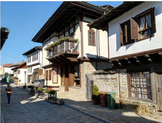
Вдясно е къщата на Пенчо Славейков