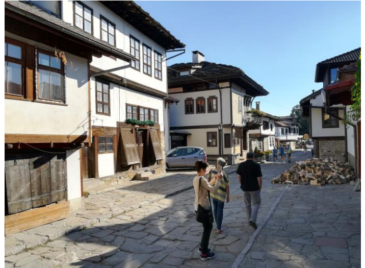
С приятели по улицата на занаятите с къщи във възрожденски стил