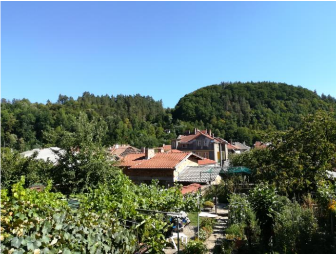
Изглед от балкона на стаята ни на юг към Стара планина

От 8 до 12 август бяхме в Трявна. Отседнахме в самостоятелни стаи в къща близо до Улицата на занаятите , по която се разхождахме всеки ден.