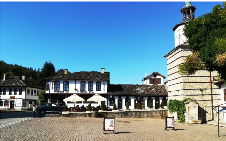
Центърът с часовниковата кула. Наоколо - галерии, магазини и музеи в хубави сгради.