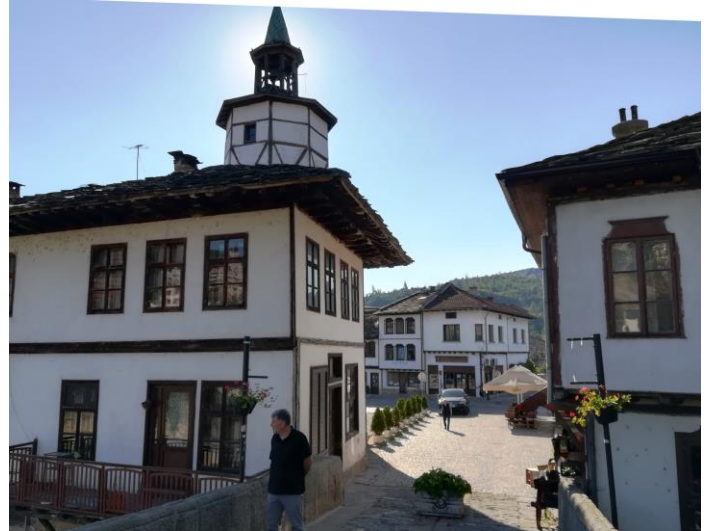
По мостчето – към центъра на Трявна.