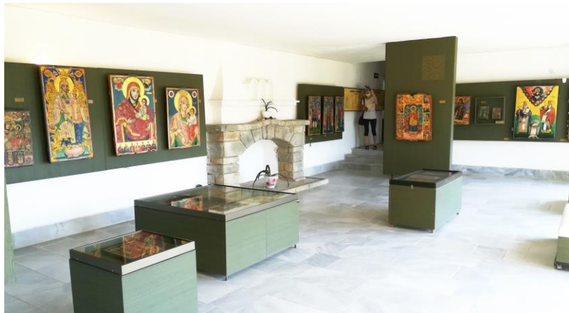
В Музея на иконите разгледахме икони от Тревненската иконописна школа.